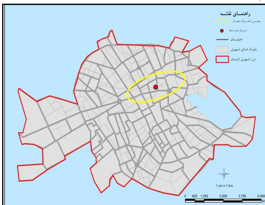
نقشه‌ی شماره‌ی (۲): مرکز متوسط و بیضی انحراف معیار جرایم مرتبط با مواد مخدر در شهر

نگهداری مواد مخدر این نقطه مطابق مرکز متوسط کل جرایم بر تقاطع خیابان‌های شریعتی و شهید چمران واقع شده است و امتداد بیضی انحراف معیار نیز به سمت شرق و غرب شهر می‌باشد. مرکز متوسط جرم خرید و فروش مواد مخدر در ابتدای خیابان شهداء نزدیک میدان مشتاقیه و امتداد بیضی نیز نشان‌دهنده‌ی پراکنندگی این نوع جرم در سمت شمال شرقی و جنوب غربی می‌باشد. در نهایت مرکز متوسط و بیضی انحراف معیار جرم اعتیاد و استعمال مواد مخدر نشان می‌دهد که این جرایم به مرکزیت میدان مشتاقیه و در امتداد شمال شرقی و جنوب غربی هستند.