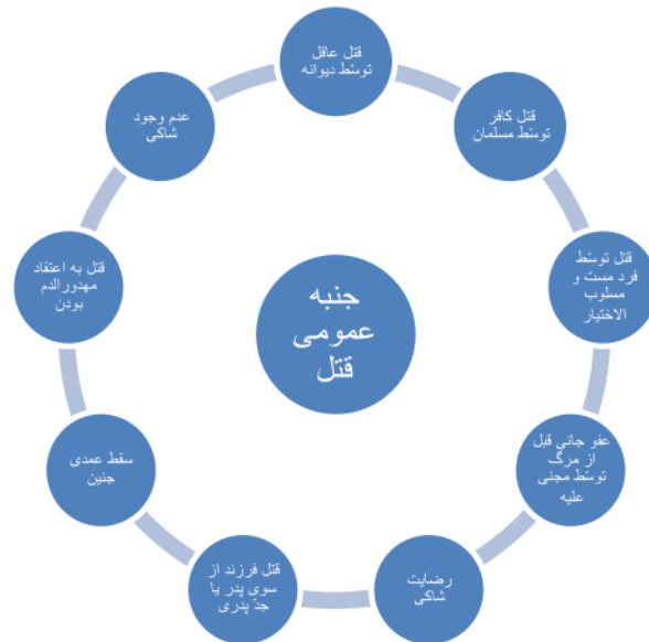
نمودار شماره ۲: موارد جنبه عمومی در جنایات در قانون مجازات اسلامی